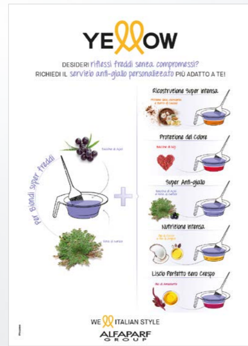
Desk display PARA COMUNICAR AOS SEUS CLIENTES OS SERVIÇOS PERSONALIZADOS DE YELLOW SILVER